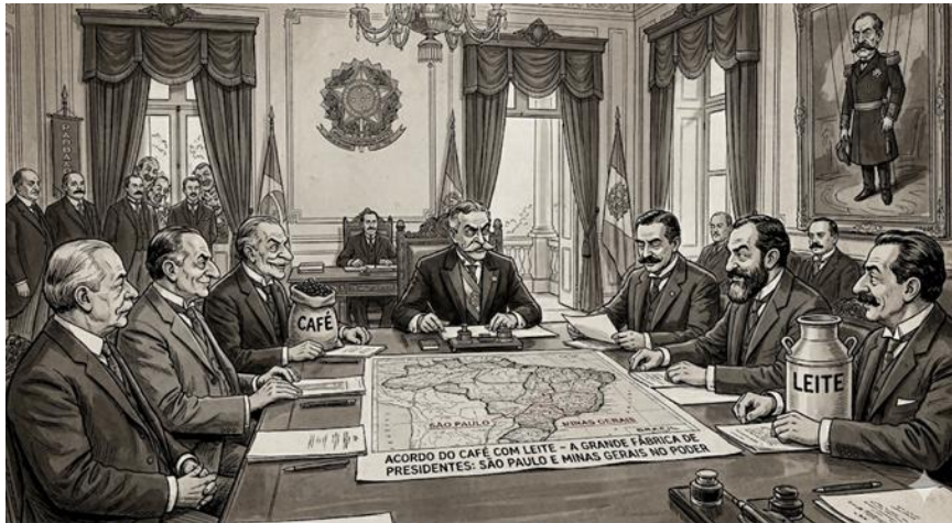
Imagem criada por IA – Sem direitos autorais

1ª Questão. A política dos governadores, idealizada por Campos Sales, constituiu o alicerce do regime oligárquico. Tratava-se de um compromisso recíproco: o governo federal não intervinha nos estados, garantindo o poder das elites locais, e, em troca, as bancadas estaduais no Congresso apoiavam sistematicamente os projetos do Executivo Federal. O controle do voto, por meio do coronelismo e do “bico de pena”, assegurava a manutenção desse circuito fechado.